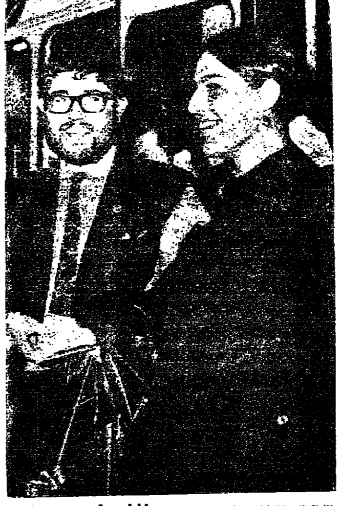
الطردان من موسكو وصلا الى لندن